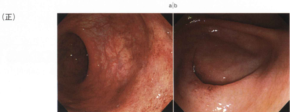
図 5 直腸と虫垂部の病変(43歳発症, 男性)